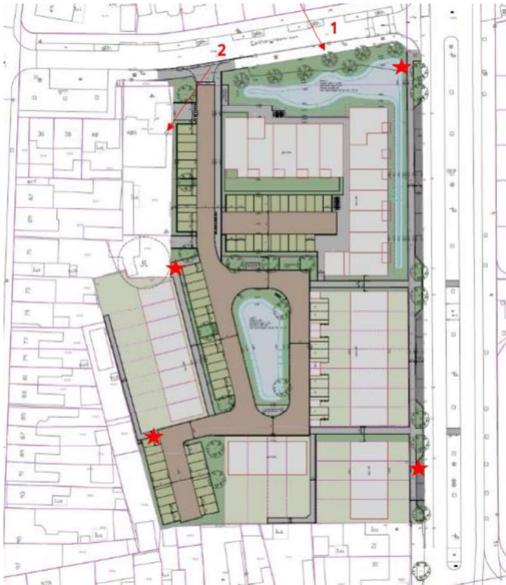
Figuur 2. Voorgestelde locaties van de tijdelijke voorzieningen. Sterren zijn indicaties van paalkasten. Nummer 1 is een indicatie van de geplande boomkasten. Nummer 2 is een indicatie van kasten aan de gevel van Catharinastraat 40A.