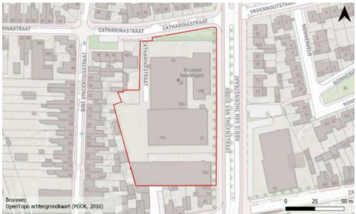
Figuur 1. Locatie Abdis van Thornstraat 68, 68A t/m 68C, 70, 70A en Catharinastraat 42, postcodegebied 4901 te Oosterhout. De activiteiten vinden plaats binnen het omliggende gebied.