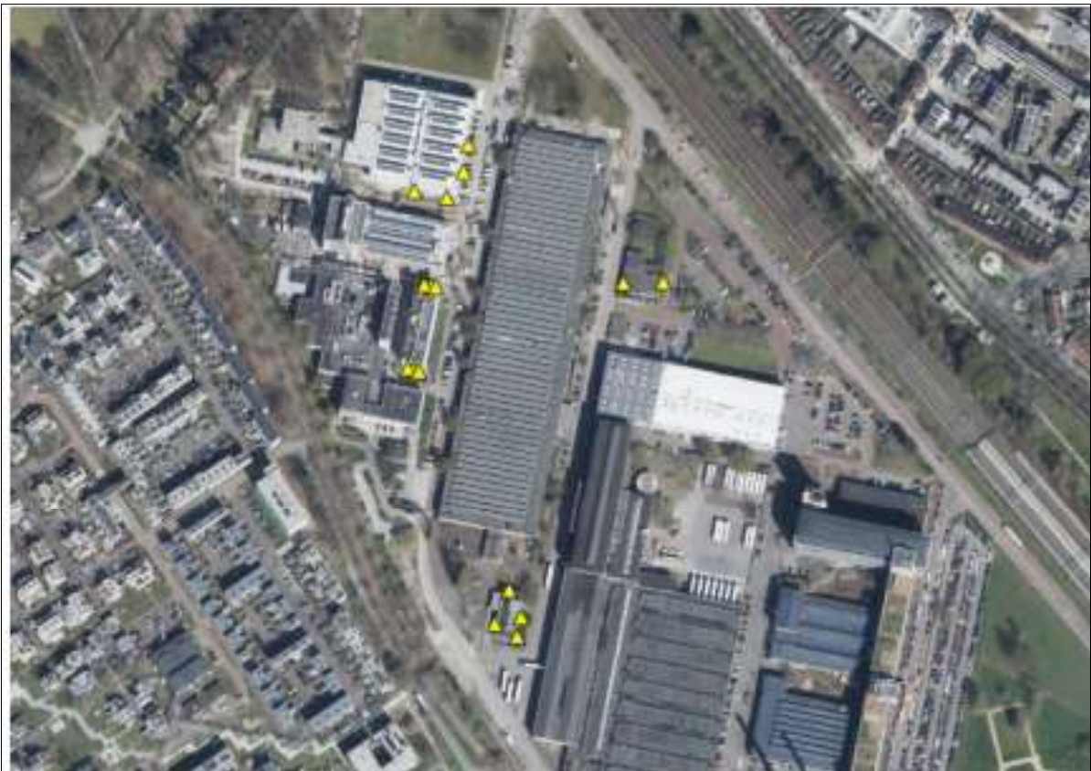
Figuur 3. Locatie van de tijdelijke voorzieningen.