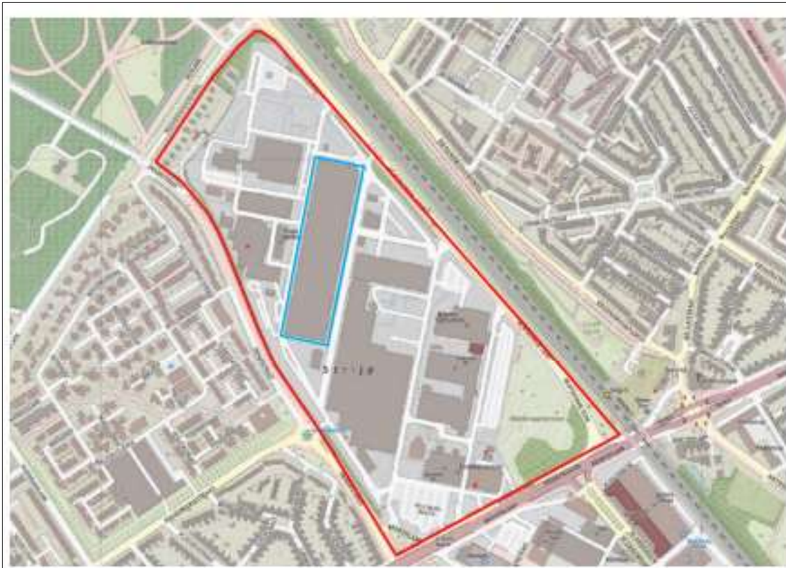
Figuur 1. Locatie gebouw Strijp TX nabij Zwaanstraat 100, 5651 CA, Eindhoven. De activiteiten vinden plaats binnen het blauw omlinjde gebied.