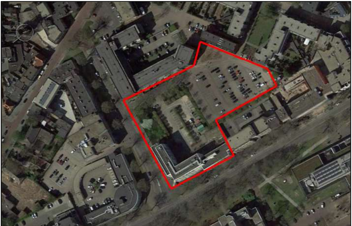
Figuur 1. Locatie Lievekamplaan 1 te Oss. De activiteiten vinden plaats binnen het omliggende gebied.