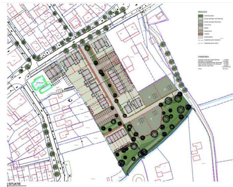
Figuur 2. Bouwplan locatie Lieshoutseweg 52, 5492 HR te Sint-Oedenrode.