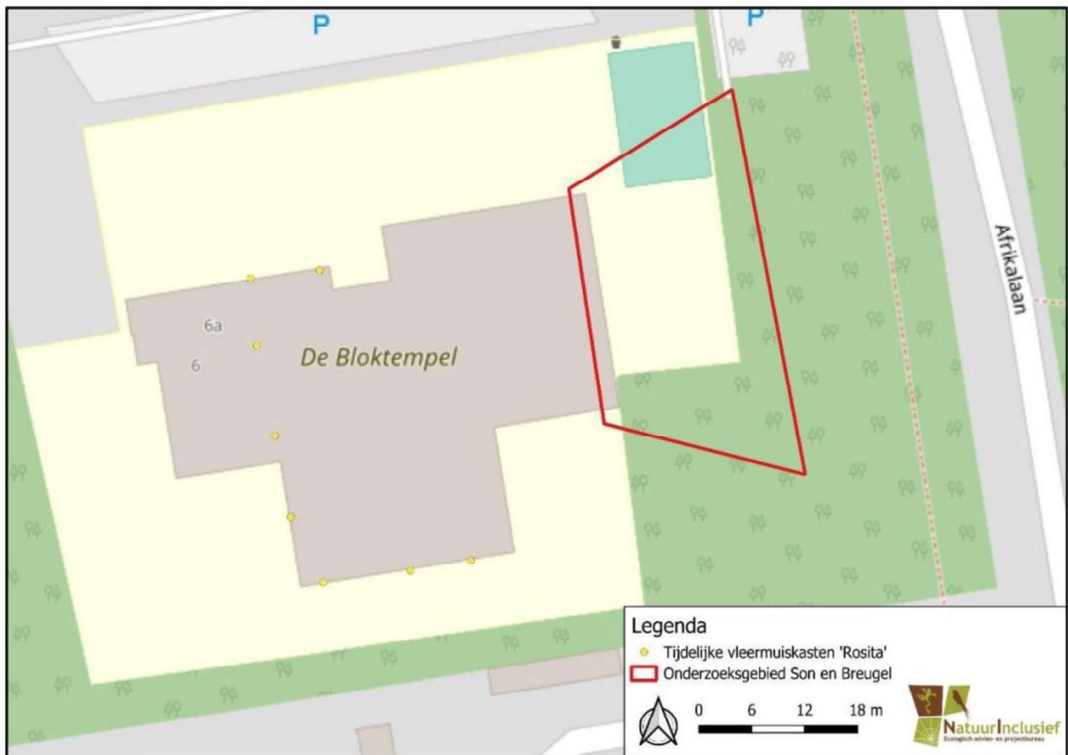
Figuur 2. Locatie van de tijdelijke voorzieningen.