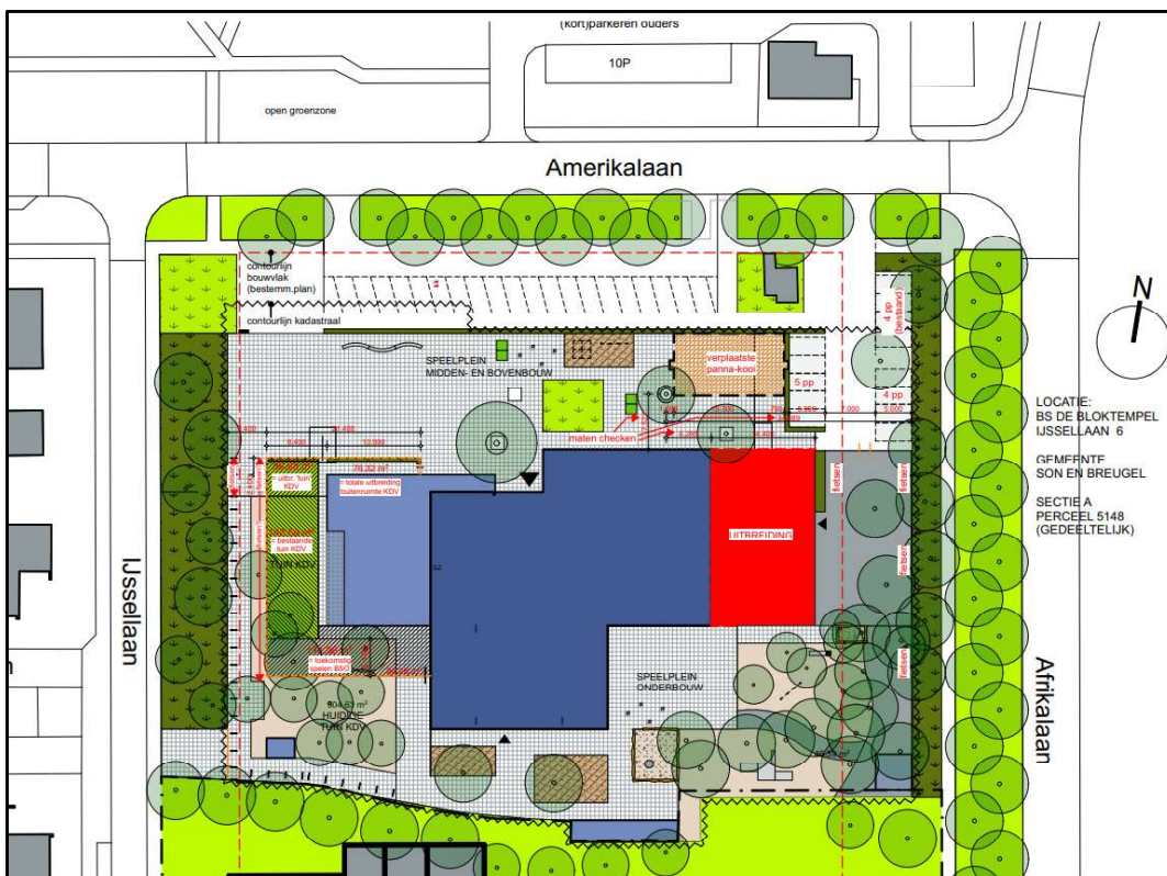
Figuur 3. Ontwerp van de nieuwe situatie. In rood is de voorgenomen aanbouw weergegeven.