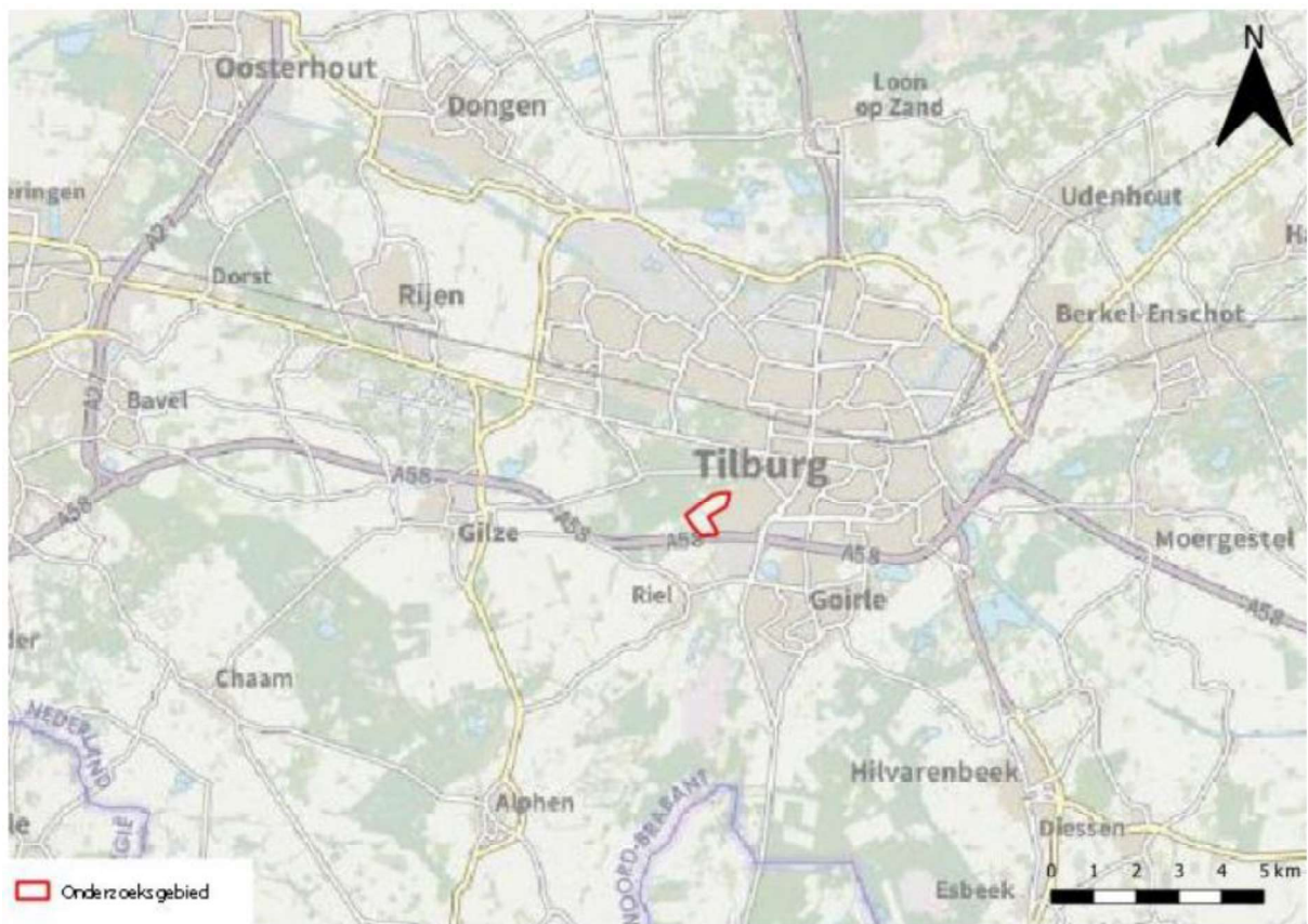
Figuur 1. Locatie de Kaaistoep en De Blaak gemeente Tilburg. De activiteiten vinden plaats binnen het omliggende gebied.