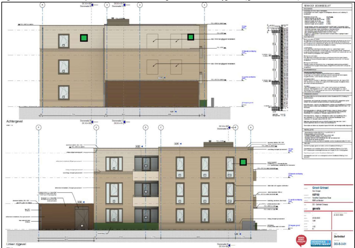
Figuur 4. Locatie van de permanente voorziening in de achtergevel en linker zijgevel (groen vierkant).