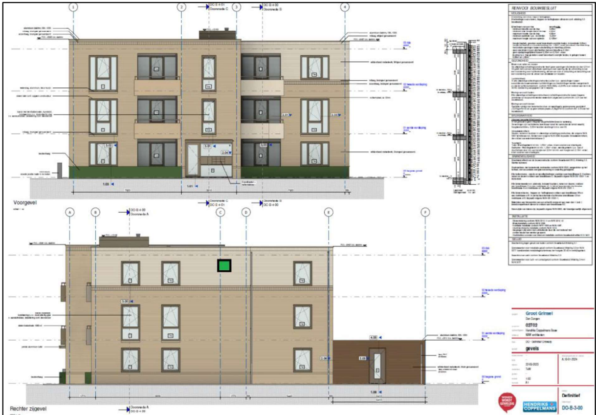
Figuur 3. Locatie van de permanente voorziening in de rechter zijgevel (groen vierkant).