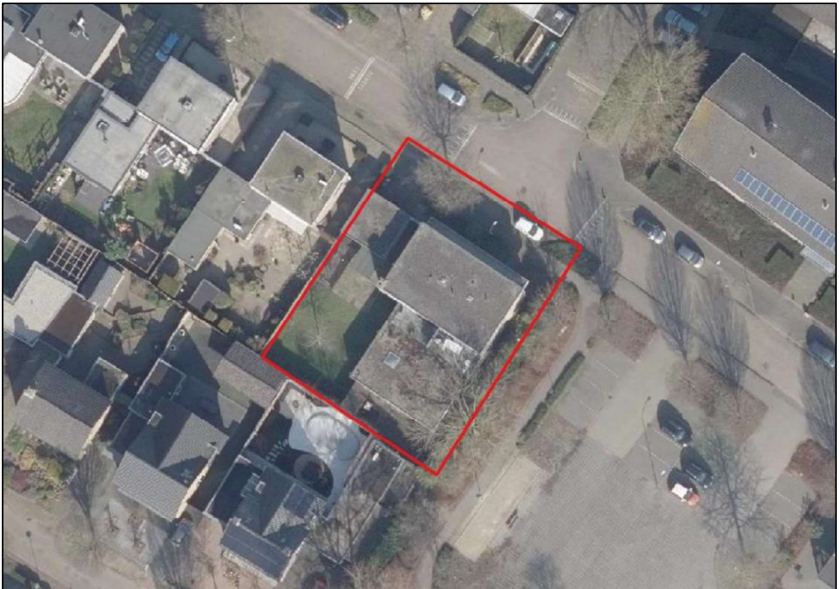
Figuur 1. Locatie Groot Grinsel 12 t/m 16, 5275 BZ te Den Dungen. De activiteiten vinden plaats binnen het omliggende gebied.