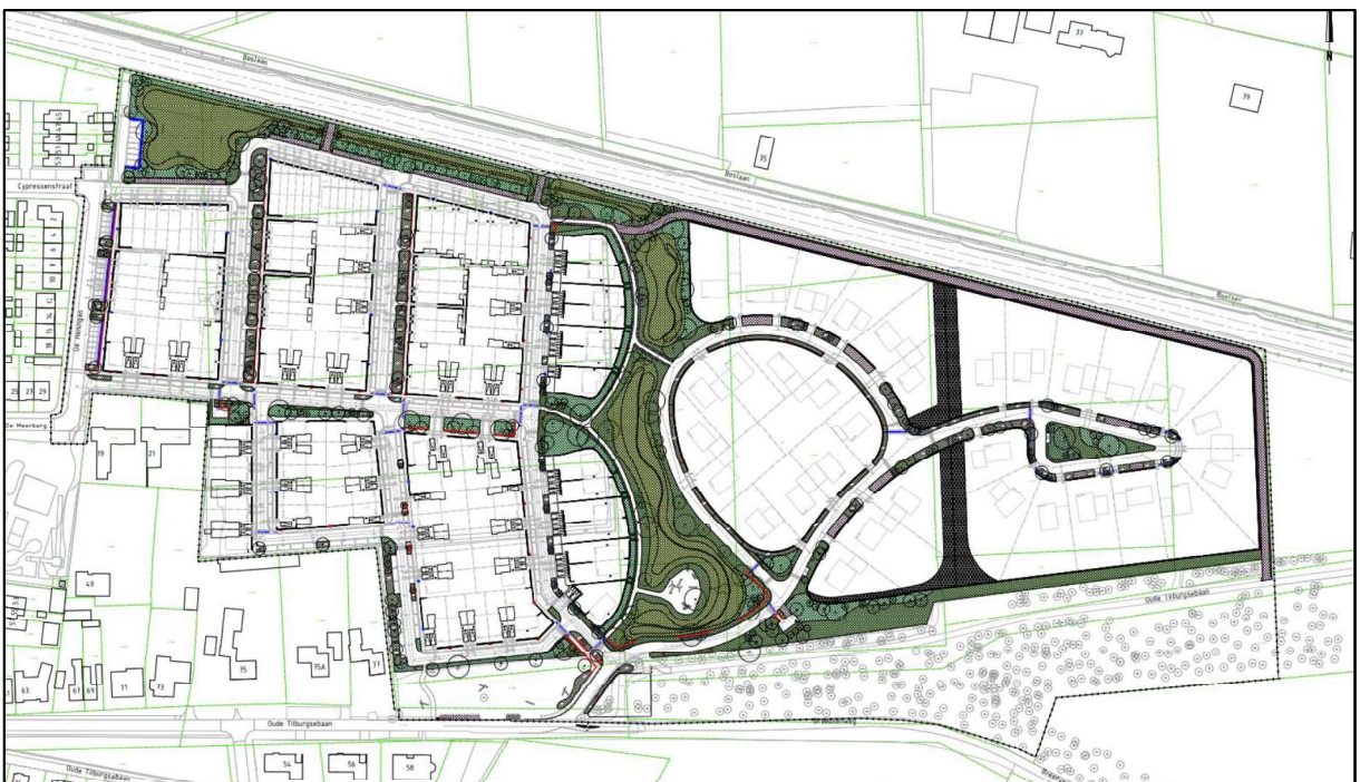
Figuur 3. Toekomstige inrichting plangebied, groene zones.