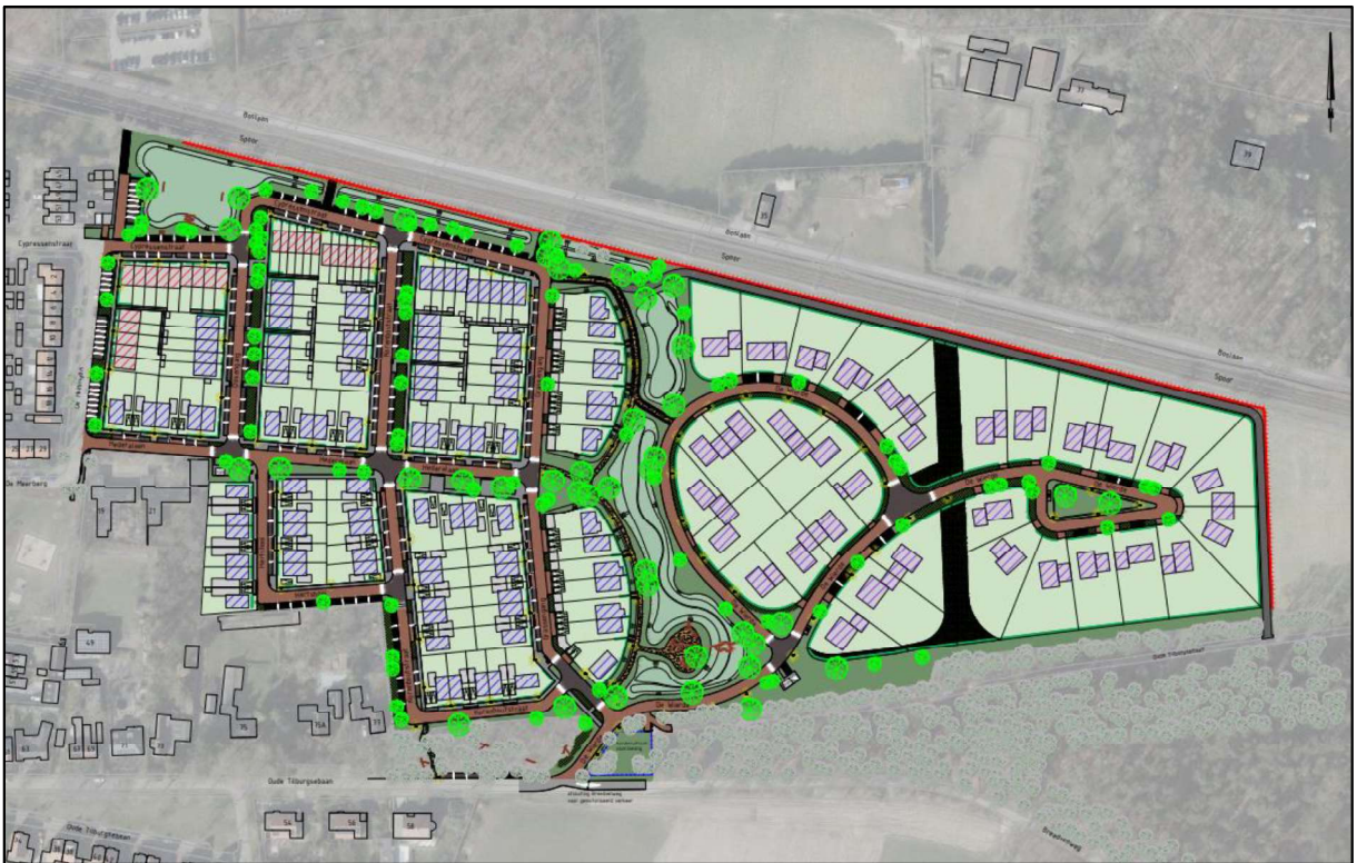
Figuur 2. Toekomstige inrichting plangebied.