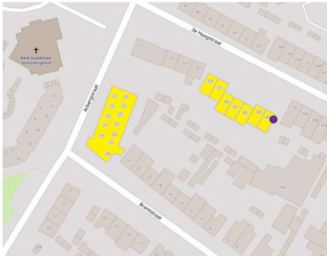
Figuur 1. Locatie 3e Haagstraat en Arbergstraat te Helmond. De activiteiten vinden plaats binnen het gele gebied. De zomerverblijfplaats van de laatvlieger bevindt zich bij de paarse stip.