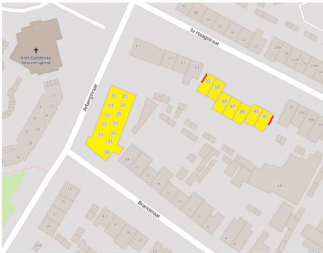
Figuur 3. Locatie van de permanente voorzieningen. De maatwerkvoorzieningen worden geplaatst bij de rode lijnen.