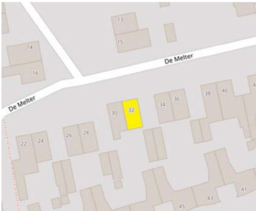
Figuur 1. Locatie de Melter 32, 5737 AK te Lieshout. De activiteiten vinden plaats binnen de geel gearceerde woning.