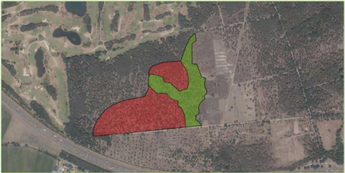
Figuur 3. Weergave van potentieel geschikt leefgebied voor kleine marterachtigen binnen het plangebied. Geschikt gebied is groen, ongeschikt gebied is rood.