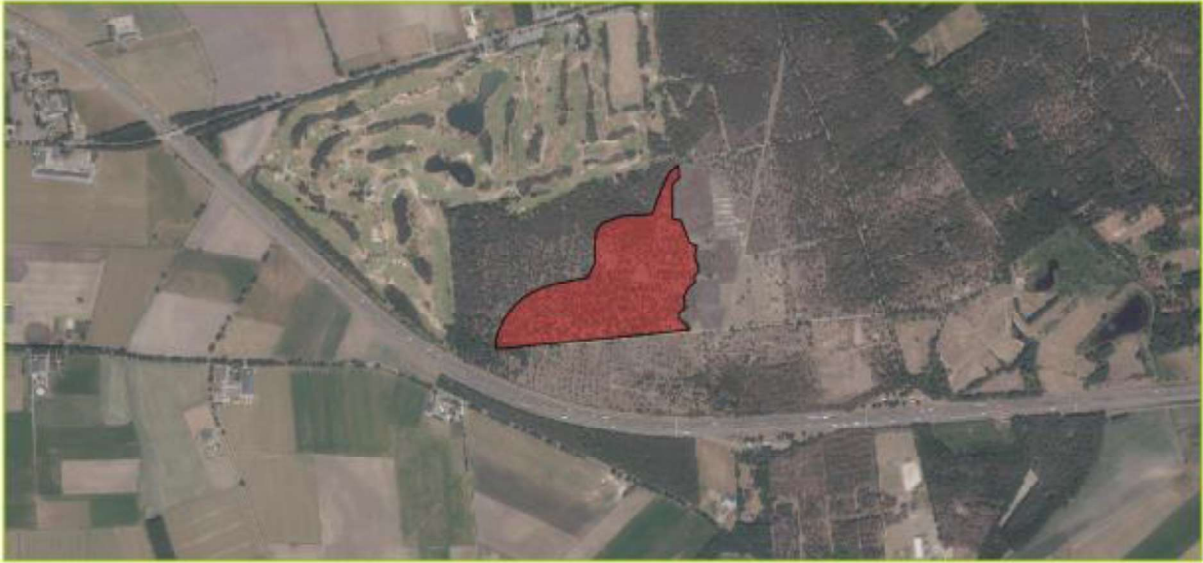
Figuur 1. Locatie van het plangebied binnen natuurgebied de Kaaistoep te Tilburg. De activiteiten vinden plaats binnen het rode gebied.