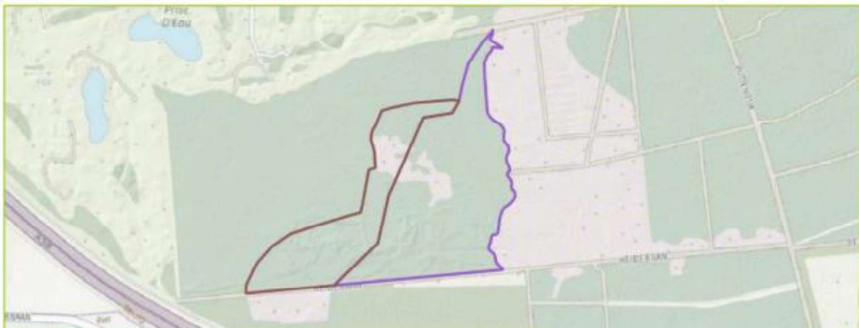
Figuur 2. Schematische weergave van de toekomstige situatie in het plangebied. Het paarsomlijnde gebied wordt heide. Het bruin omlijnde gebied wordt bosheide.