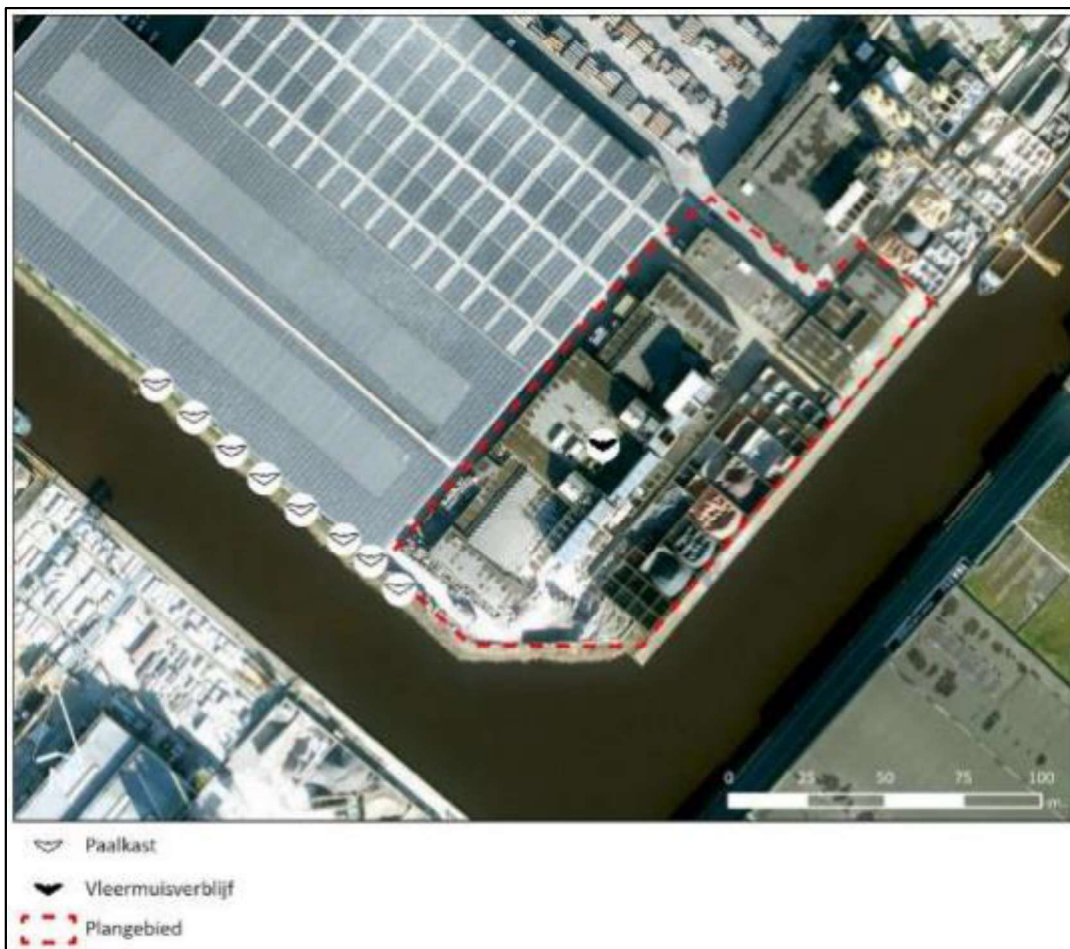
Figuur 2. Locatie van de tijdelijke voorzieningen (paalkasten).