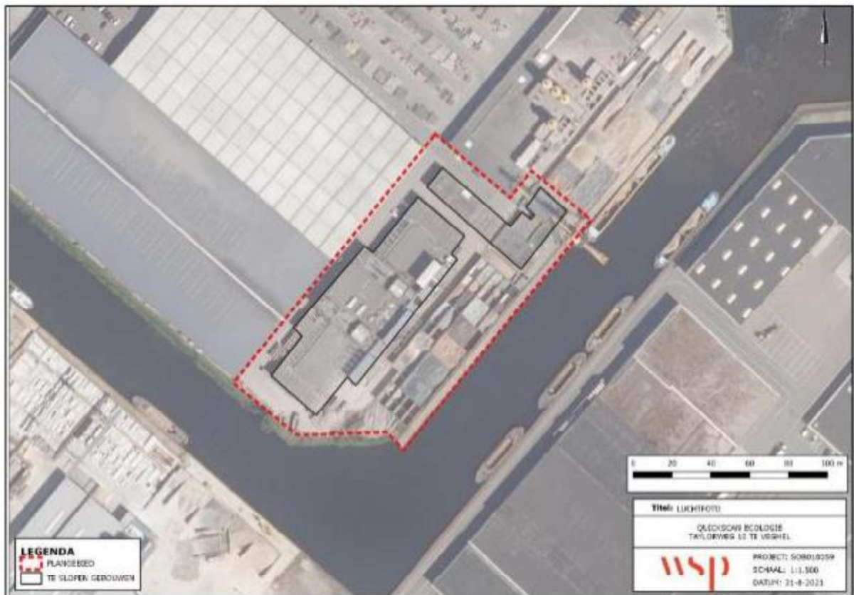
Figuur 1. Locatie Taylorweg 10, 5466 AE te Veghel, in de gemeente Meierijstad. De activiteiten vinden plaats binnen het omliggende gebied, alleen de oude fabriek wordt gesloopt en niet de bijgebouwen.