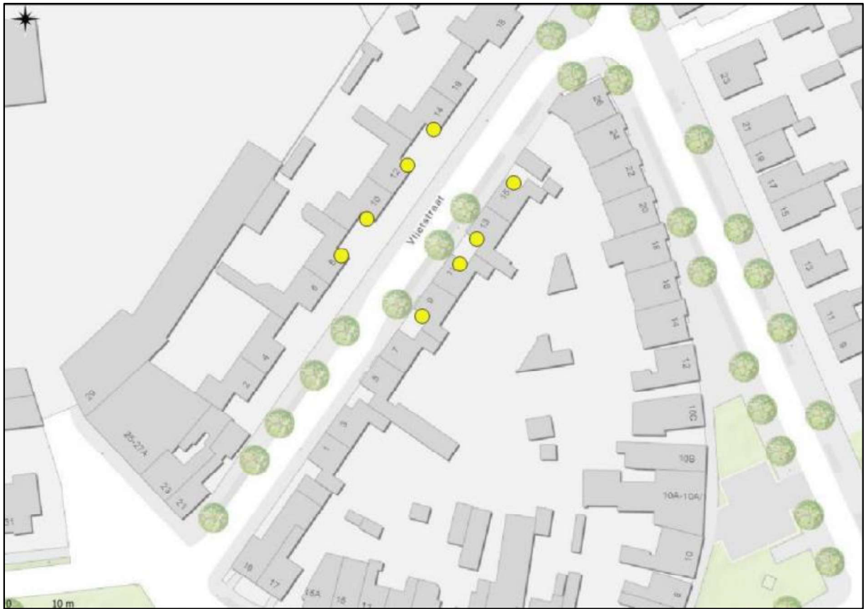
Figuur 6. Locaties van de permanente voorzieningen voor de gewone dwergvleermuis (gele stippen).