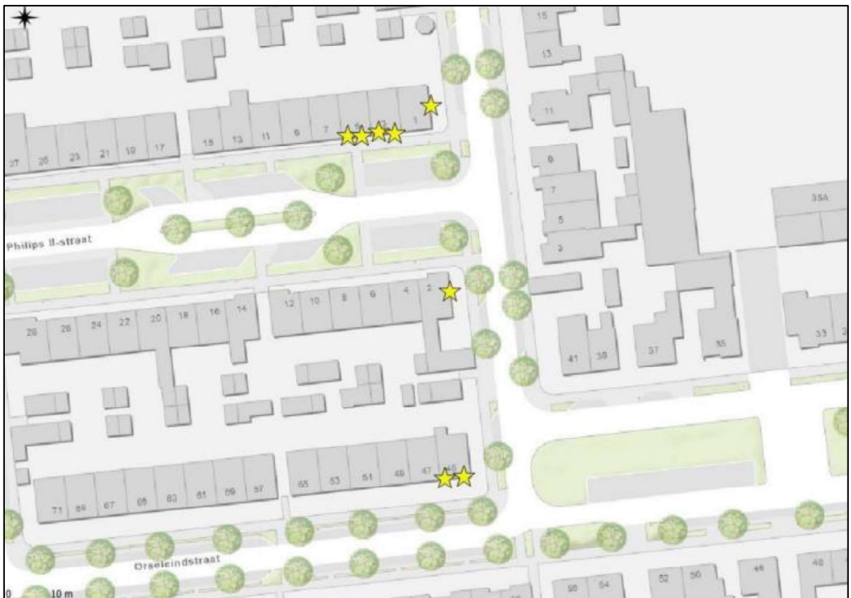
Figuur 4. Locaties van de tijdelijke voorzieningen voor de gewone dwergvleermuis (gele sterren).