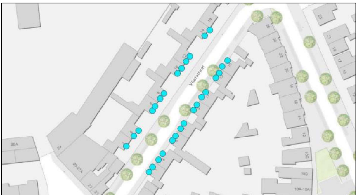
Figuur 5. Locaties van de permanente voorzieningen voor de huismuis en gierzwaluw (blauwe stippen).