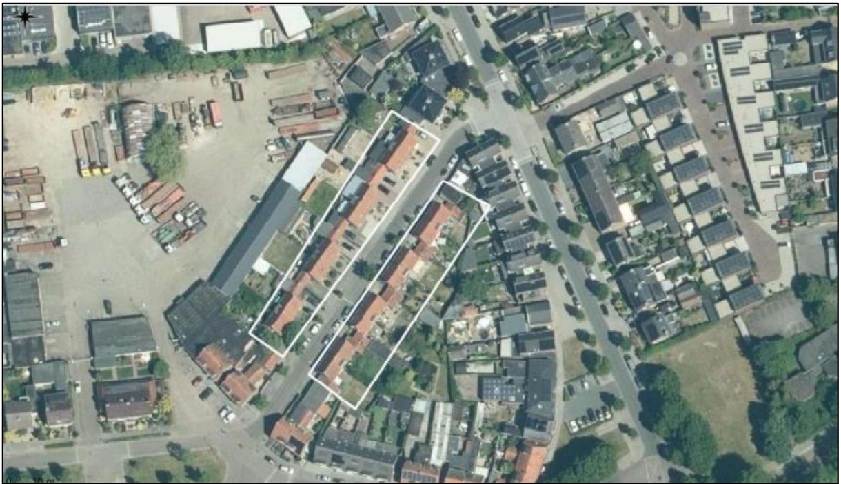
Figuur 1. Locatie Vlietstraat 1 t/m 16 te Oss. De activiteiten vinden plaats binnen de omliggende gebieden.