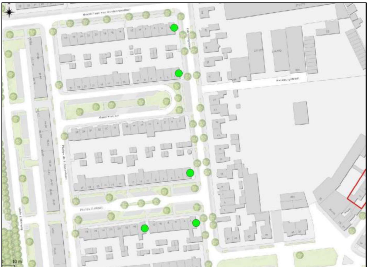
Figuur 3. Locaties van de tijdelijke voorzieningen voor de gierzwaluw (groene stippen). Elke stip betreft 5 gierzwaluwkasten.