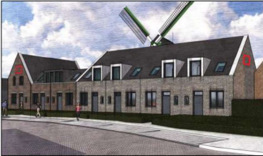
Figuur 3. Beoogde locatie van de permanente vleermuisvoorzieningen.