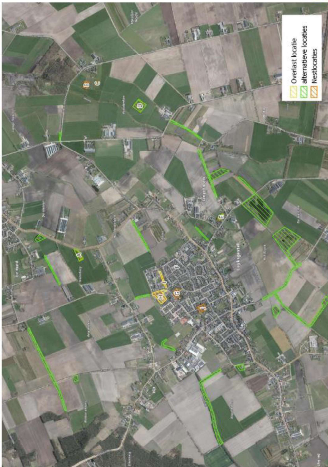
Figuur 1. De ontheffing is enkel van toepassing op locaties H en I. Deze locatie is gelegen in de omgeving Tillaars en Kruisboomweg te Luykgestel. Met groen zijn de alternatieve locaties, waar de roek mag broeden weergegeven. Binnen de overige locaties met roekennesten (A t/m G) worden geen verjaagsacties toegepast of nesten verwijderd.