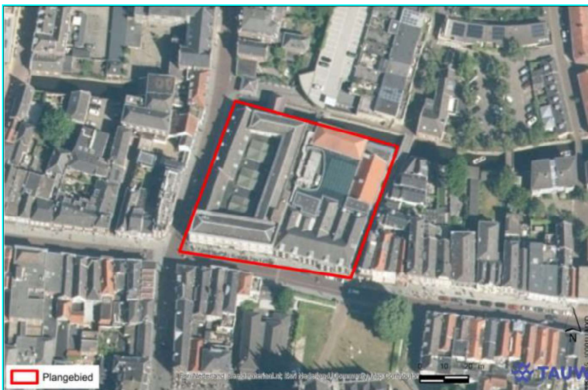
Figuur 1. Locatie Huis73 aan de Hinthamerstraat 72 en 74. De activiteiten vinden plaats binnen het omliggende gebied.