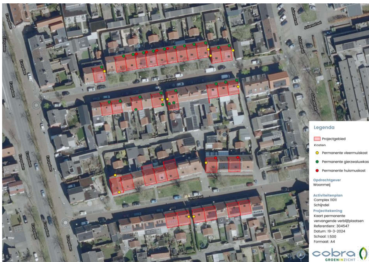
Figuur 3. Locatie van de permanente voorzieningen. Indien particulieren aanhaken zullen daar ook, conform de voorschriften, voorzieningen worden gerealiseerd.