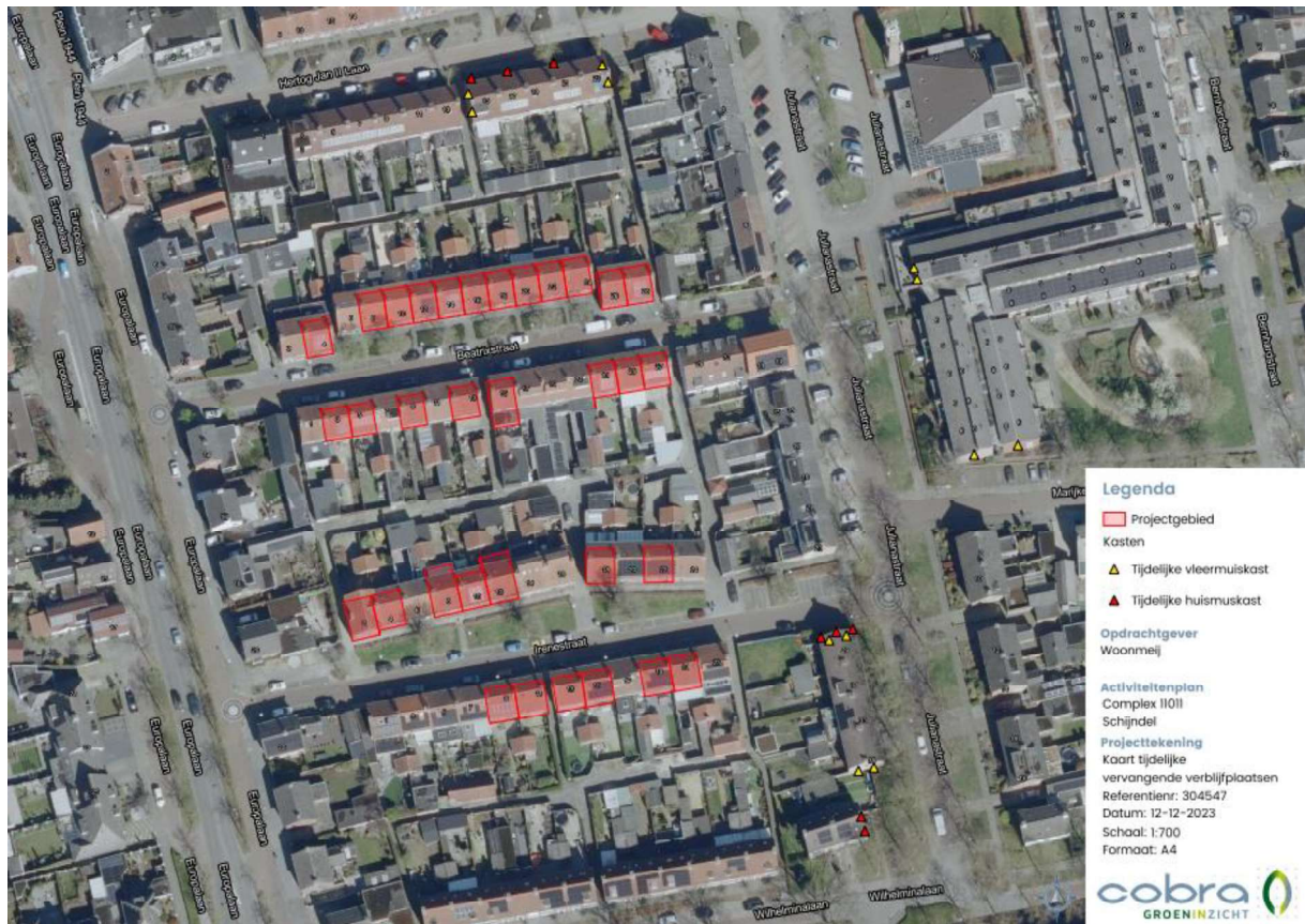
Figuur 2. Locatie van de tijdelijke voorzieningen.