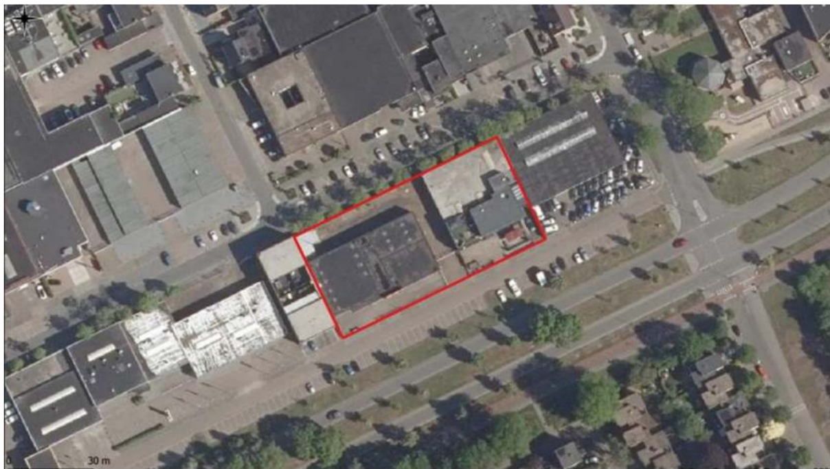
Figuur 1. Locatie Euterpelaan 7-11, 5344 CA, Oss. De activiteiten vinden plaats binnen het omlijnde gebied.