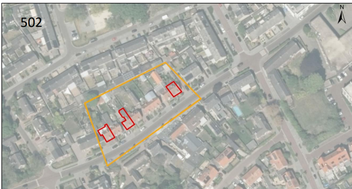
Figuur 1. Locatie Molenstraat 24, 34 en 38 te Waalre. De activiteiten vinden plaats binnen de rood omlinjnde gebieden.