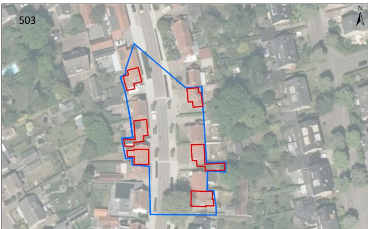
Figuur 2. Locatie Wollenbergstraat 14, 18, 20, 21, 25 en 29 te Waalre. De activiteiten vinden plaats binnen de rood omlinjnde gebieden.