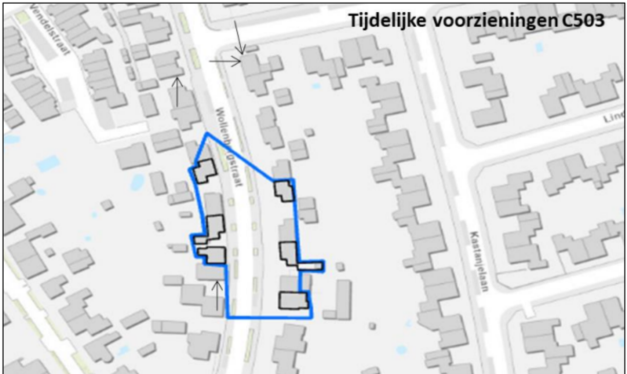
Figuur 3. Locaties van de tijdelijke voorzieningen ter compensatie van de aangetroffen verblijfplaats in de woning aan de Wollenbergstraat.