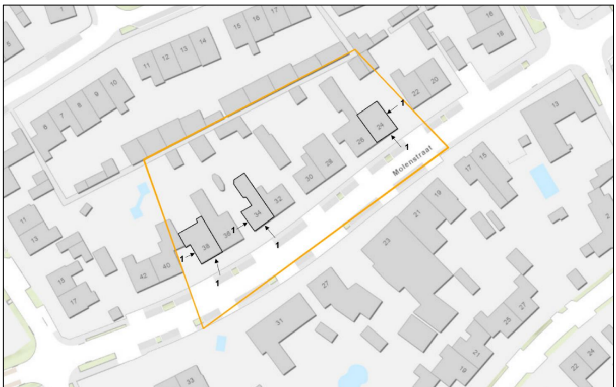
Figuur 4. Locaties van de permanente voorzieningen ter compensatie van de aangetroffen verblijfplaatsen in de woningen aan de Molenstraat.