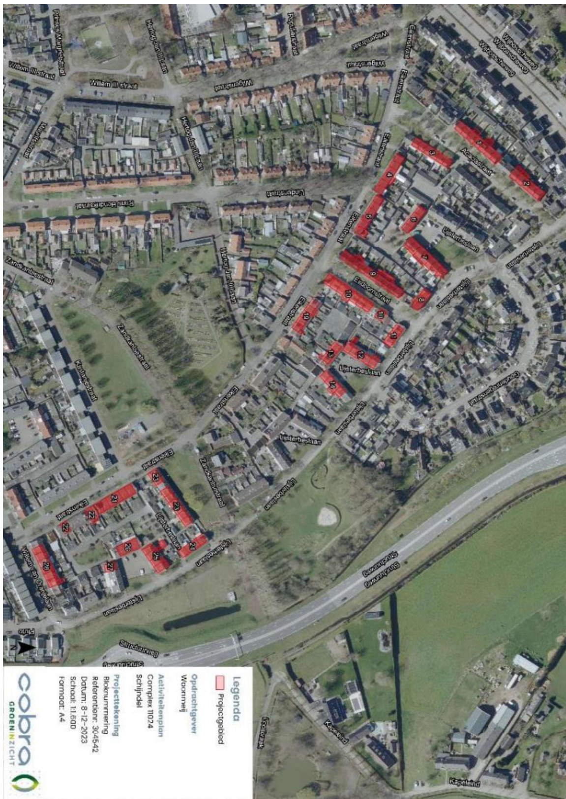
Figuur 1. Locatie Acaciastraat, Lijsterbeslaan, Eikenstraat, Esdoornstraat, Willem van Oranje straat en Zandkantsestraat te Schijndel. De activiteiten vinden plaats aan alle woningen binnen de woningblokken met rode vlakken. De woningen met rode vlakken zijn in bezit van Woonmeij. De woningen zonder rood vlak in de voorgenoemde woonblokken zijn in bezit van particulieren.