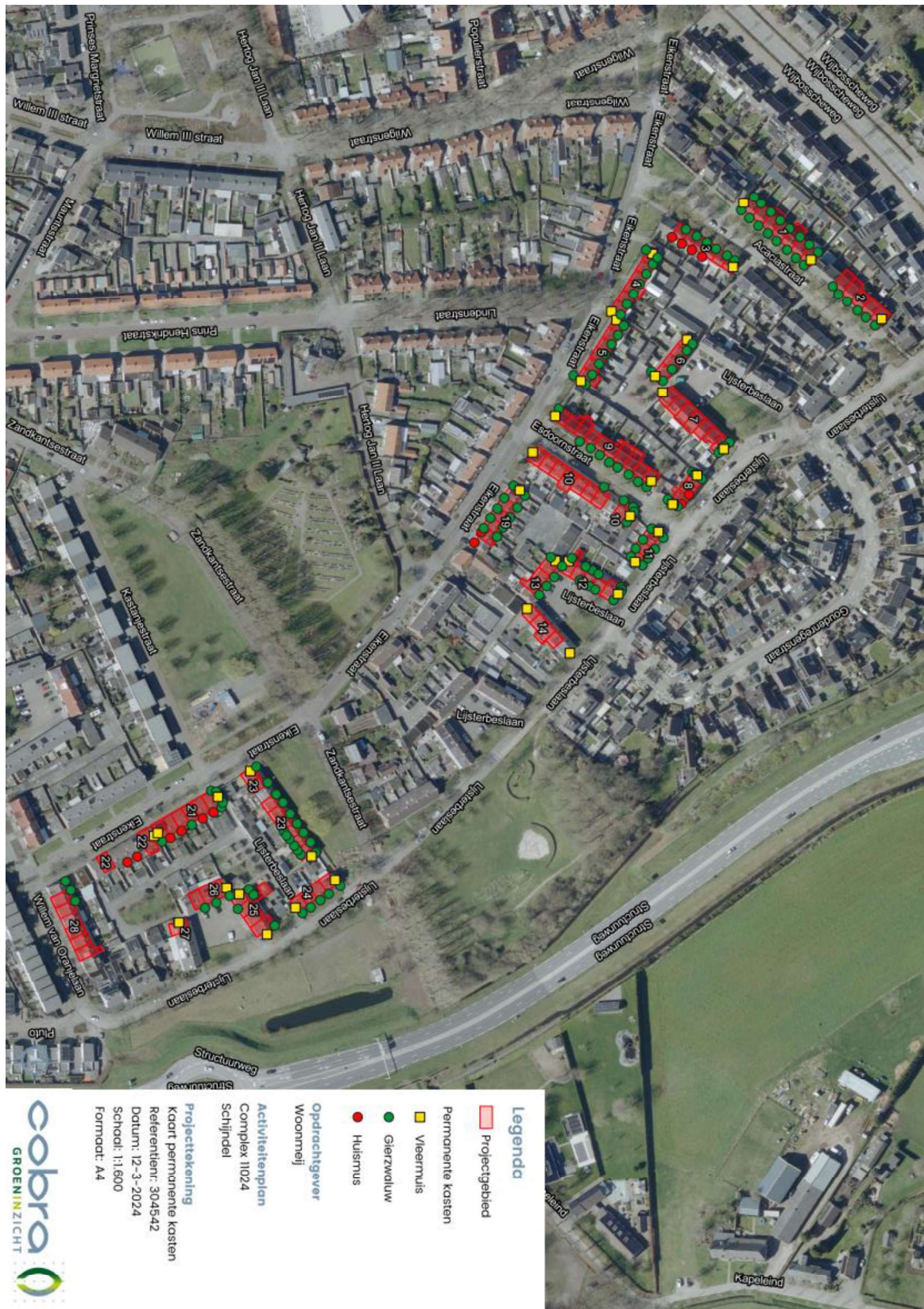
Figuur 3. Locatie van de permanente voorzieningen. Die gele vierkanten zijn vleermuisvoorzieningen. De groene stippen zijn gierzwaluw voorzieningen. De rode stippen zijn huismus voorzieningen. Indien particulieren aanhaken zullen daar ook, conform de voorschriften, voorzieningen worden gerealiseerd.