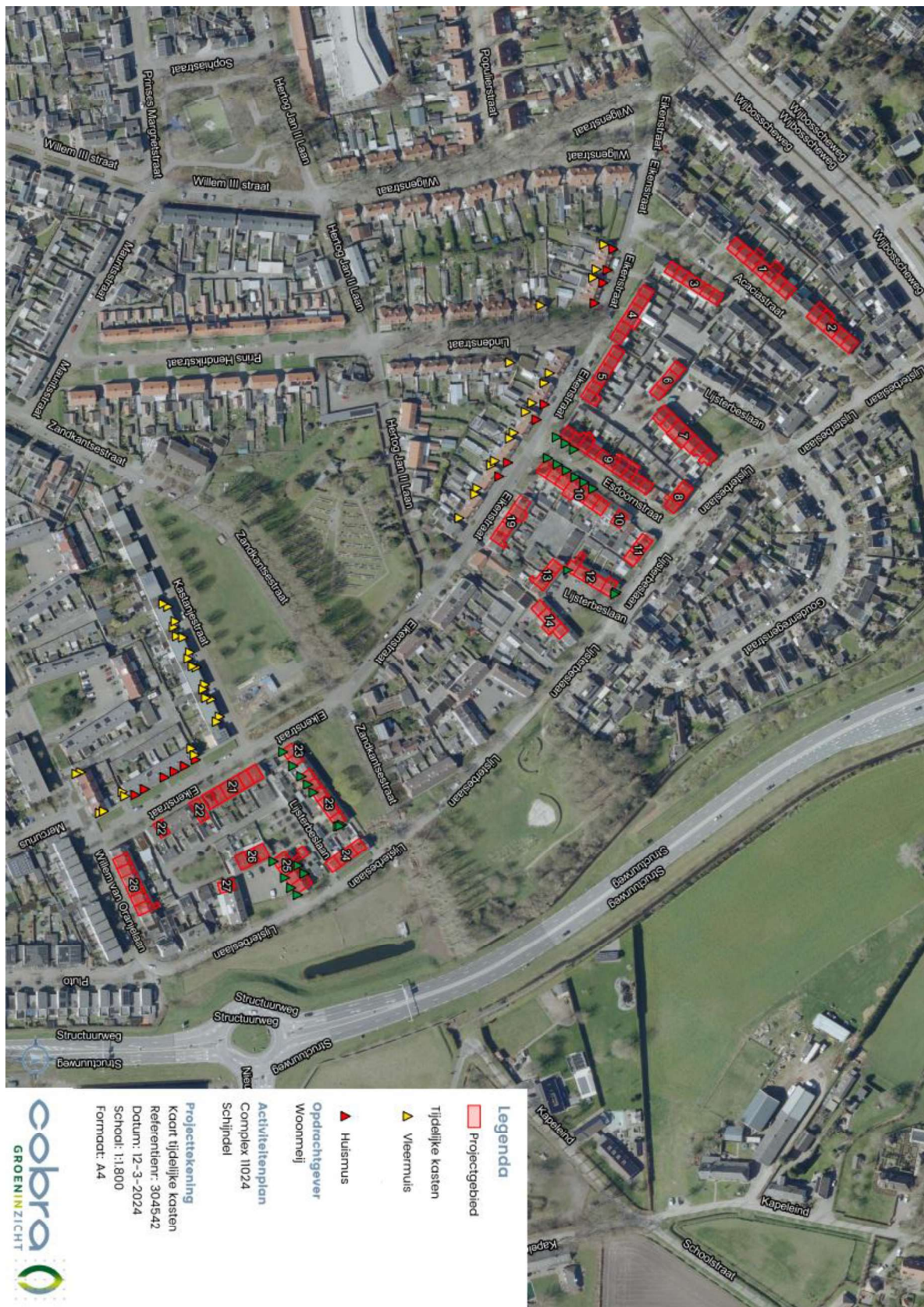
Figuur 2. Locatie van de tijdelijke voorzieningen. Vleermuisvoorzieningen zijn aangegeven met een gele driehoek. Huismuvoorzieningen zijn aangegeven met een rode driehoek. De groene driehoeken zijn niet van toepassing op deze ontheffing.