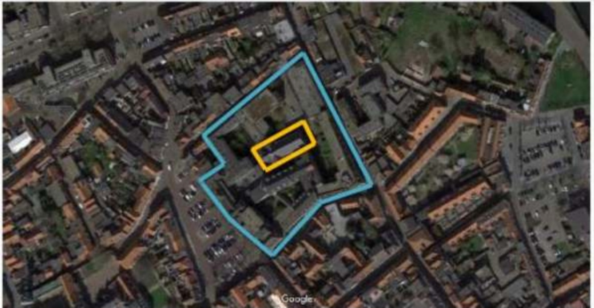
Figuur 1. Locatie Sint-Catharinaplein en omstreken te Bergen op Zoom. De activiteiten vinden plaats binnen het blauw omliggende gebied. In geel is de te behouden Kapel weergegeven.