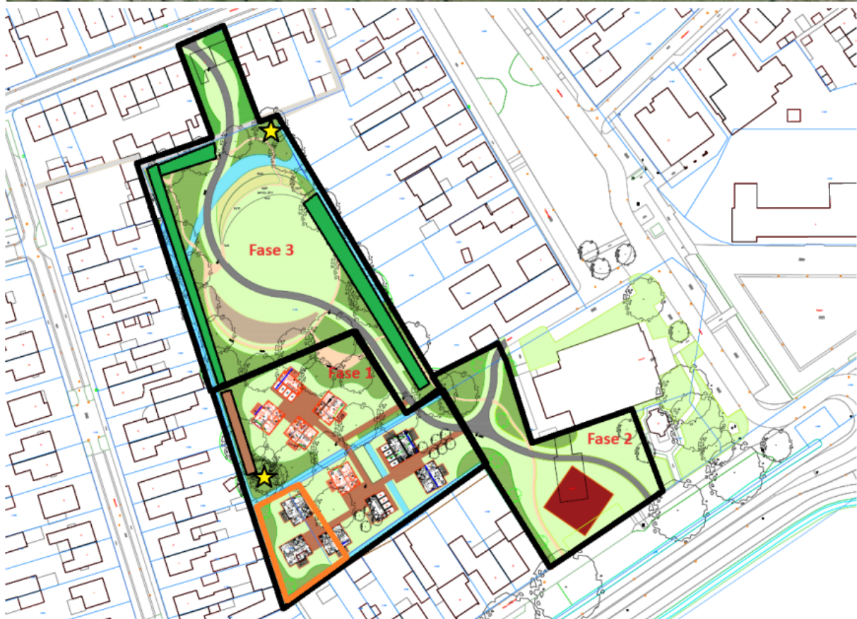
Figuur 3. Locatie van de permanente voorzieningen. Vervangende verblijfplaatsen (gele ster), takkenril (bruin vlak), dichtere ondergroei (groen vlak).