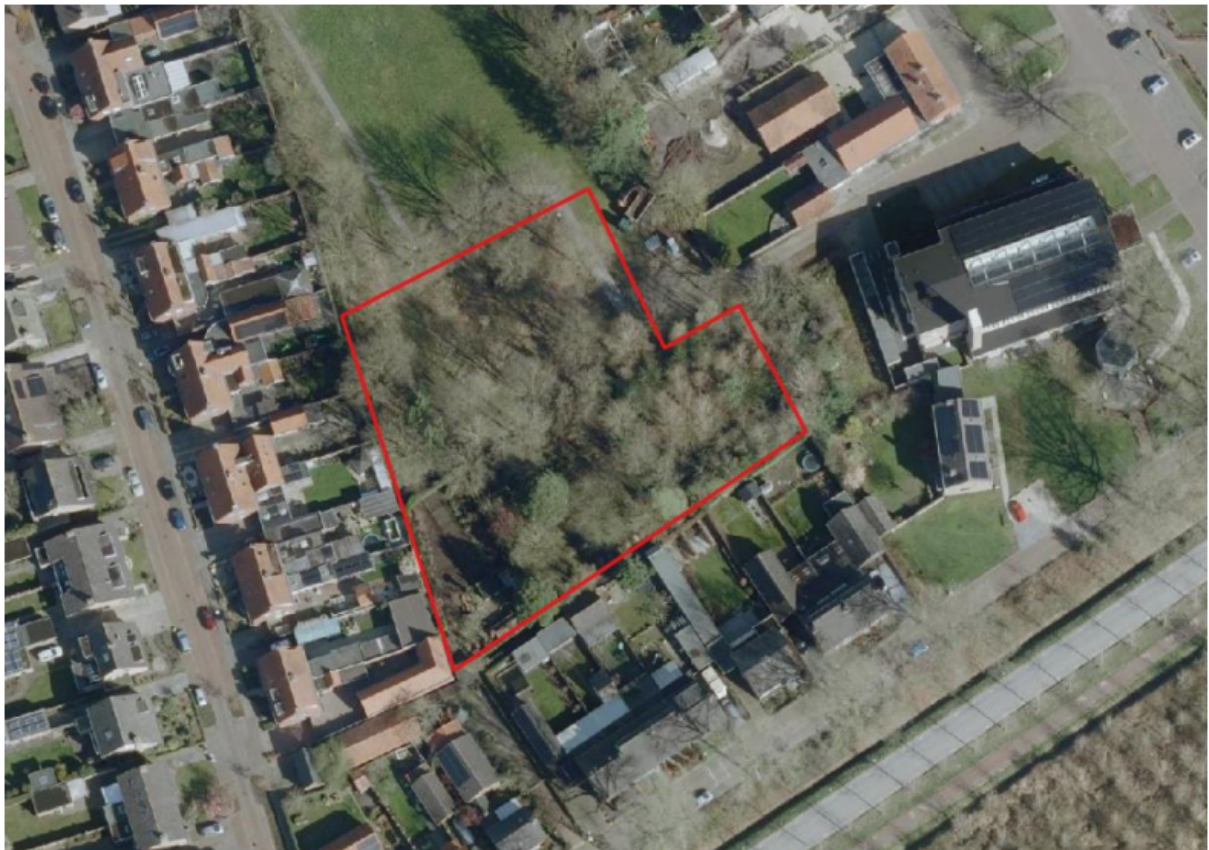
Figuur 1. Locatie pastoretuin te Boskant. De activiteiten vinden plaats binnen het omliggende gebied.