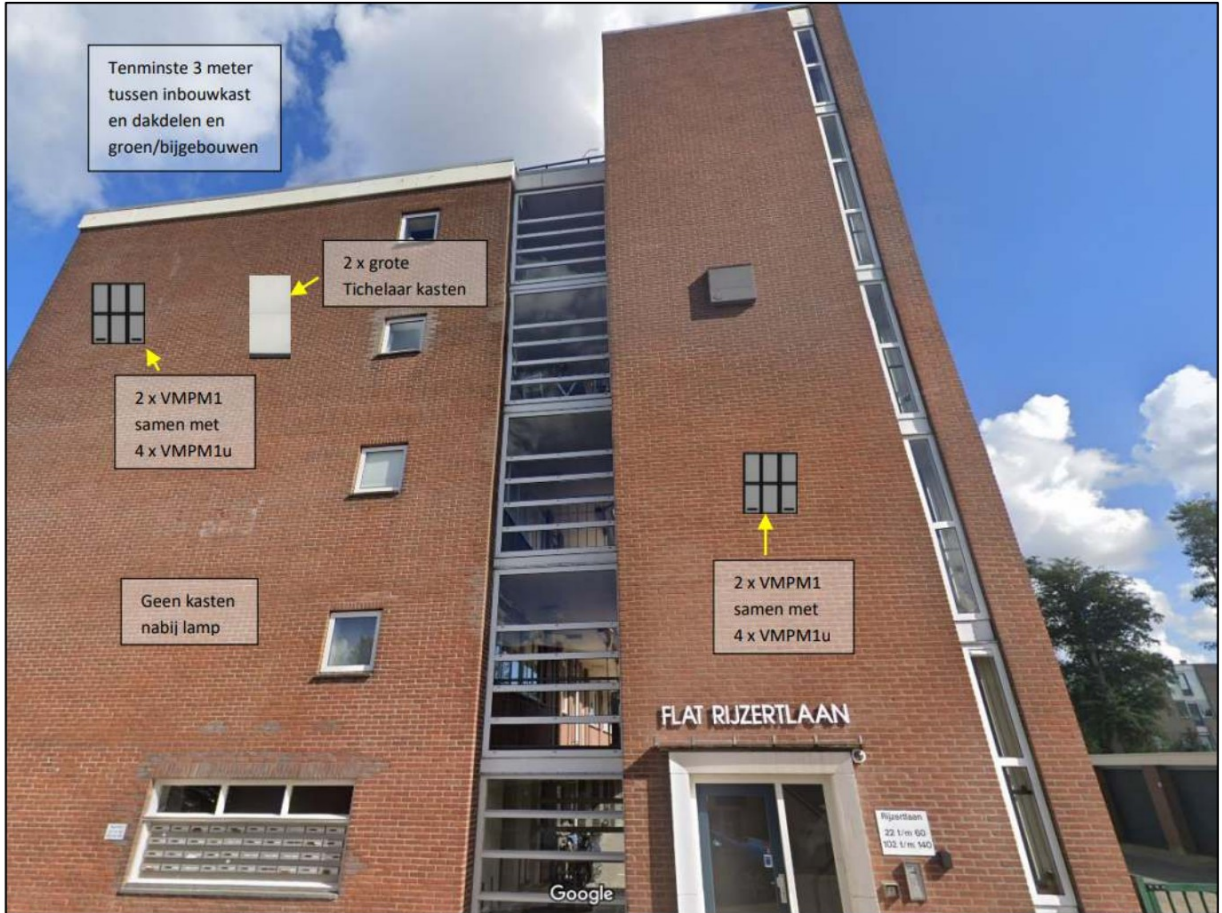
Figuur 3. Locatie van de aanwezige kraamkast met een kraamverblijfplaats van de gewone dwergvleermuis en voorzieningen die worden getroffen vanuit de taakstelling.