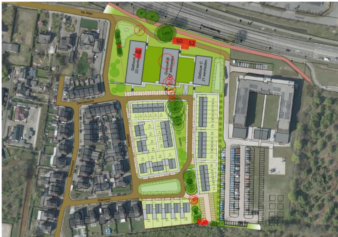
Figuur 1. Situatieschets van het plangebied met de toekomstige situatie, te slopen bebouwing (in rode vlakken), te behouden bomen (groen) en te rooien bomen (rood).