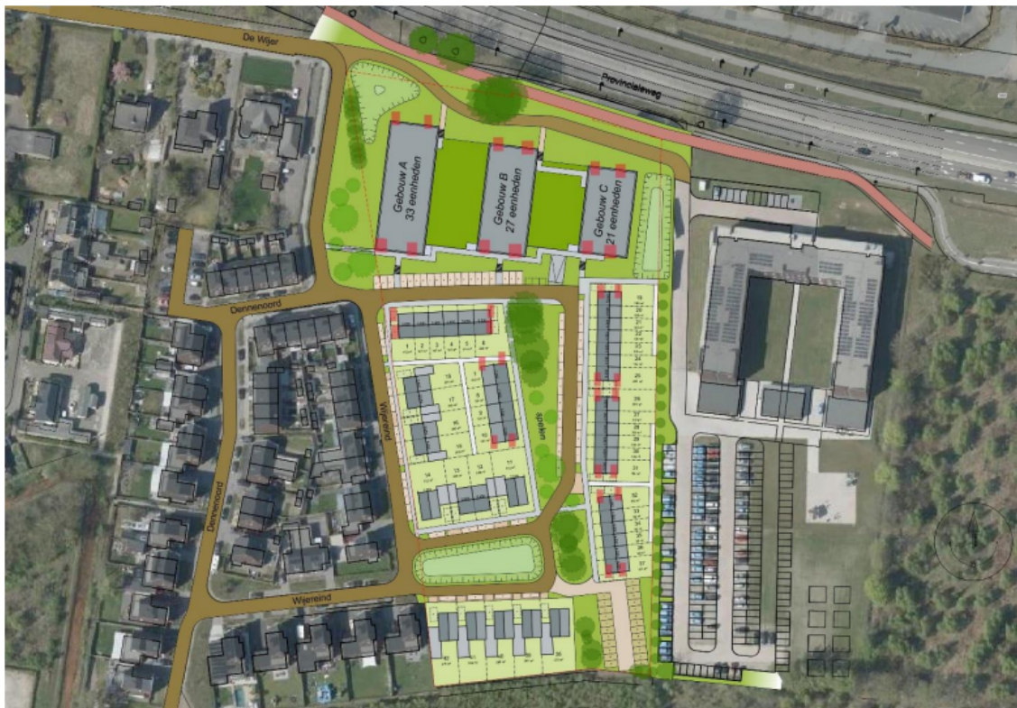
Figuur 4. Locatie van de permanente voorzieningen.