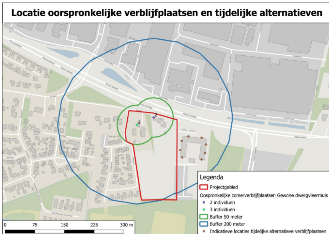
Figuur 3. Locatie van de tijdelijke voorzieningen.