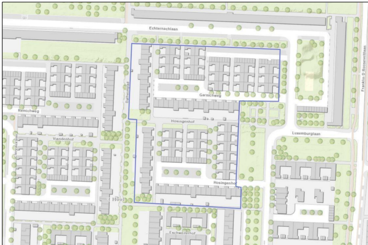
Figuur 1. Locatie complexen C2161 & C1141 aan de Hosingenhof, Luxemburglaan, Echternachlaan en Garnichweg te Eindhoven. De activiteiten vinden plaats binnen het paars omliggende gebied.