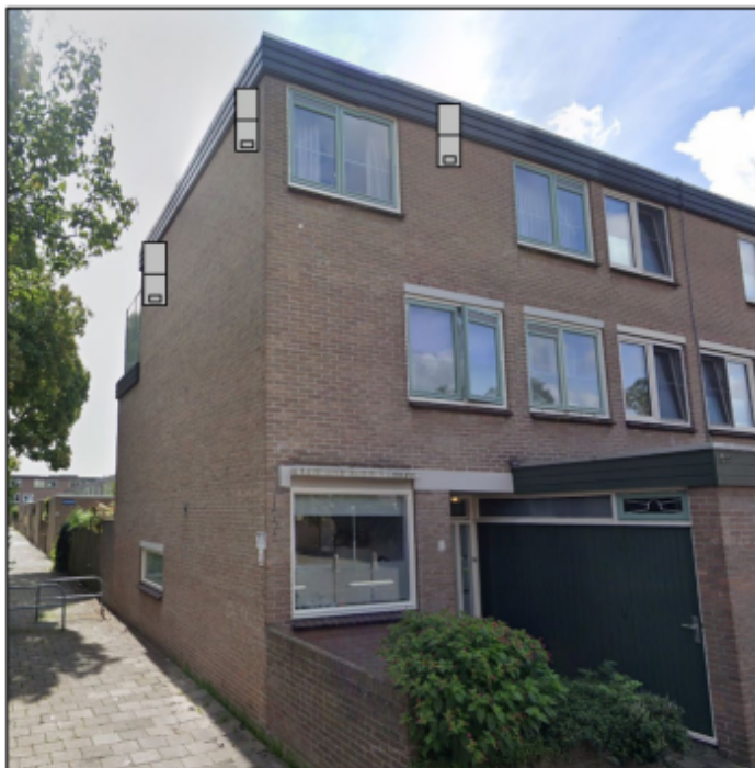
Figuur 5. Voorbeeld positie van de permanente inbouwvoorzieningen voor de vleermuis ten opzichte van de huidige situatie. In grijs worden de geschakelde inbouwvoorzieningen achter de gevelbetimmering aangegeven, met de opening aan de onderkant beneden de gevelbetimmering.