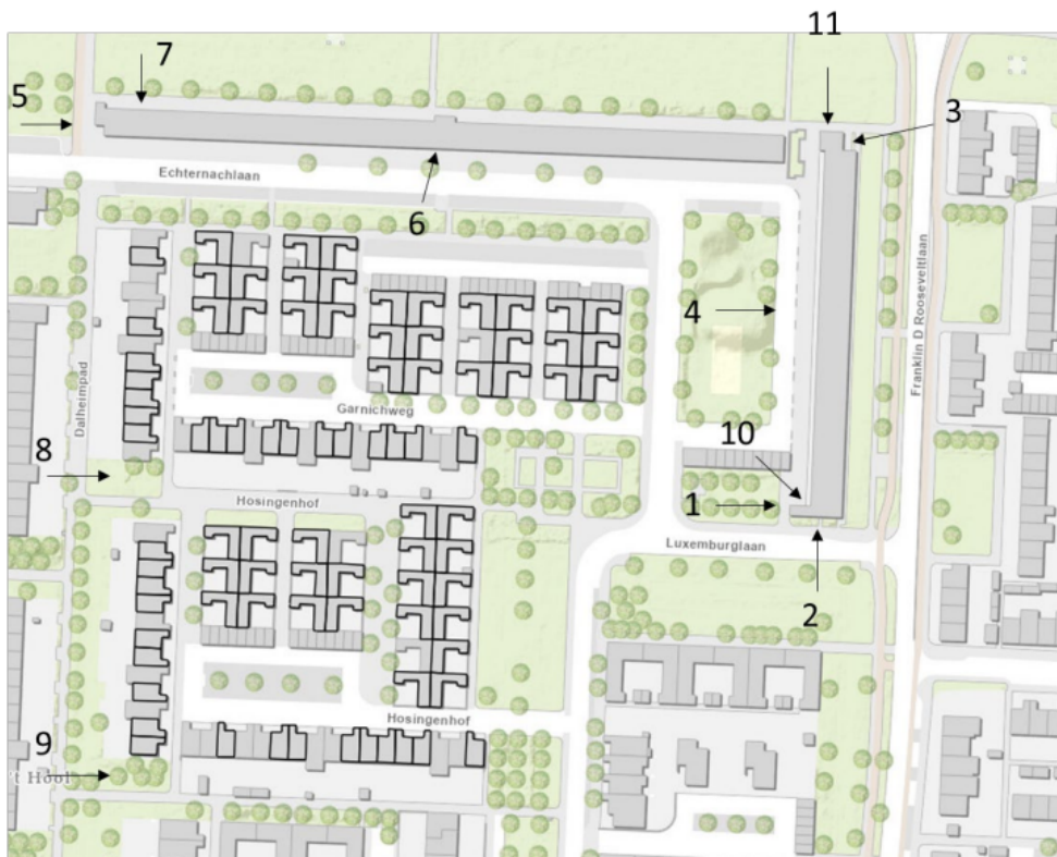
Figuur 2. Locaties van de tijdelijke vleermuisvoorzieningen. Bij locaties 1 t/m 7, 10 en 11 worden tijdelijke kasten opgehangen. Bij locaties 7, 8 en 9 worden vleermuistillen geplaatst.

Tabel 1. Overzicht van de tijdelijke vleermuisvoorzieningen. Per locatie zijn of worden meerdere vleermuisvoorzieningen geplaatst. Gele, zwarte en witte vlakken bij locaties 2 t/m 6 en 11 zijn plekken waar respectievelijk kasten van het type VMTH1 van Unitura, VK WS 09 en VK MP 07 van Vivara Pro worden bijgehangen. Het grijze vlak bij locatie 8 en 9 zijn plekken waar een extra vleermuistil van het type VMPT1 van Unitura worden geplaatst.