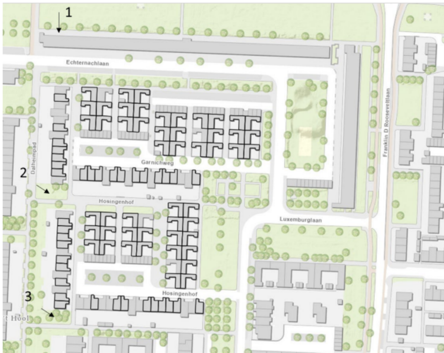
Figuur 3. Locaties van de tijdelijke huismusvoorzieningen. Bij locatie 1 worden 36 tijdelijke kisten opgehangen, verspreid over de gevel. Bij locaties 2 en 3 worden huismustillen geplaatst.