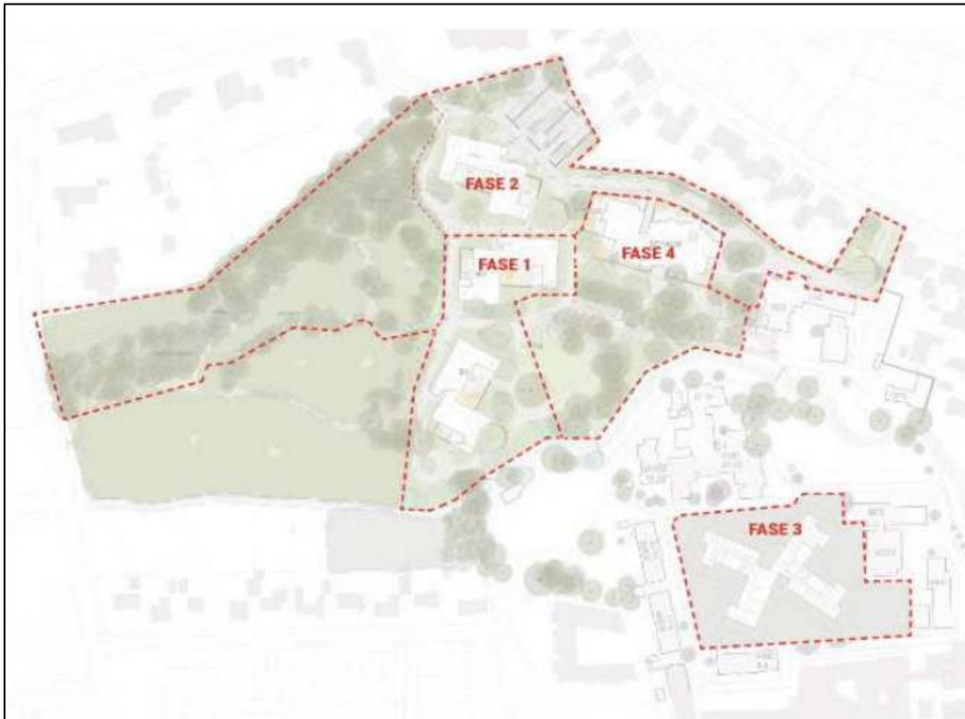
Figuur 1. Aangepaste faseverdeling. De inrichting van fase 1 en 2 zijn definitief. De inrichting van het zuidelijke gedeelte van fase 3 is in concept en het dagbestedingsgebouw 'De Schalm' in fase 4 wordt gerenoveerd in plaats van gesloopt.