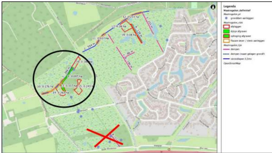
Figuur 1. Plangebied met aangepaste maatregelen. In het zuidelijke deel (rood kruis) worden geen werkzaamheden uitgevoerd. In het westelijke deel (zwarte cirkel) wordt extra aandacht aan de voorgestelde maatregelen besteedt.