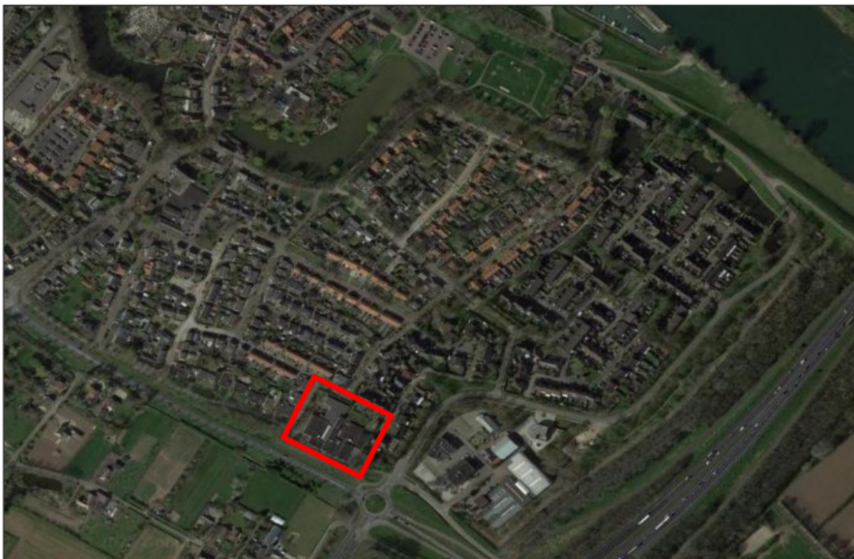
Figuur 1. Locatie Middingstraat 1 te Ravenstein. De activiteiten vinden plaats binnen het omliggende gebied.