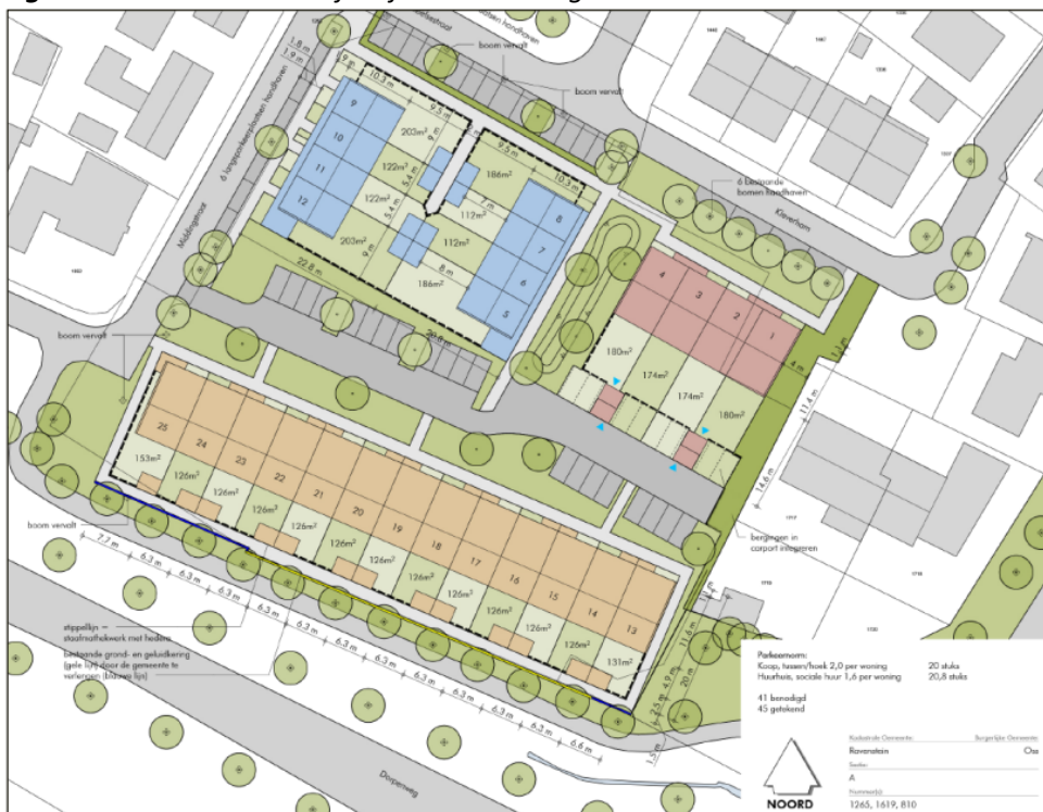
Figuur 3. Locatie van de permanente voorzieningen wanneer er voor gekozen wordt om inbouwkasten en gevelbetimmering te realiseren (op de kopgevels van de blauwe en rode woningen zullen dan nokkasten worden gerealiseerd, op de oranje woningen zullen dan geschakelde inbouwkasten in de kopgevels worden gerealiseerd).