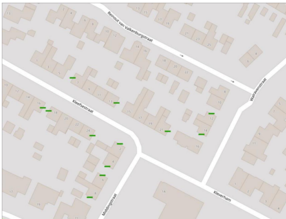
Figuur 2. Locatie van de tijdelijke voorzieningen.