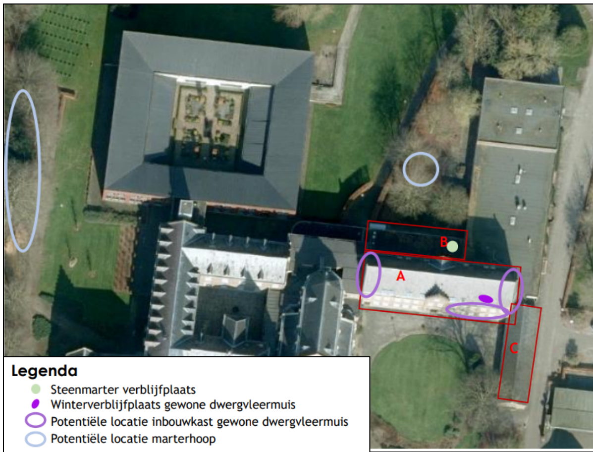
Figuur 2. Locatie van de voorzieningen (werkzaamheden aan gebouw A en dus de daar aanwezige vleermuisverblijfplaatsen vallen buiten deze aanvraag).