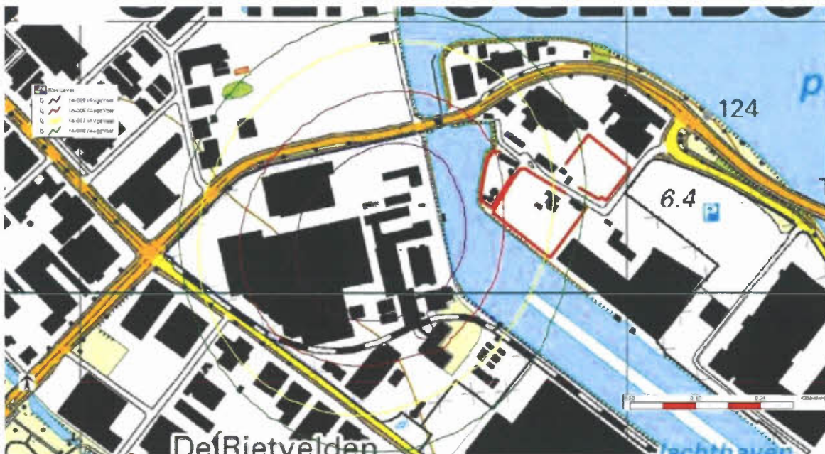
Figuur 1: Vergunde contouren plaatsgebonden risico Heineken (rode/bruine lijn is 10^{-6} /jaar contour).

In onderstaande figuur 1 is de ligging weergegeven van de vergunde contouren voor het plaatsgebonden risico (vergunning verleend op: 23 augustus 2016; in te zien onder: http://www.brabant.nl/loket/verleende-vergunningen/vergunning-detail.aspx?id=c0c0b384-17d9-4498-8ac2-25aa16027651 op de website van de provincie Noord-Brabant).