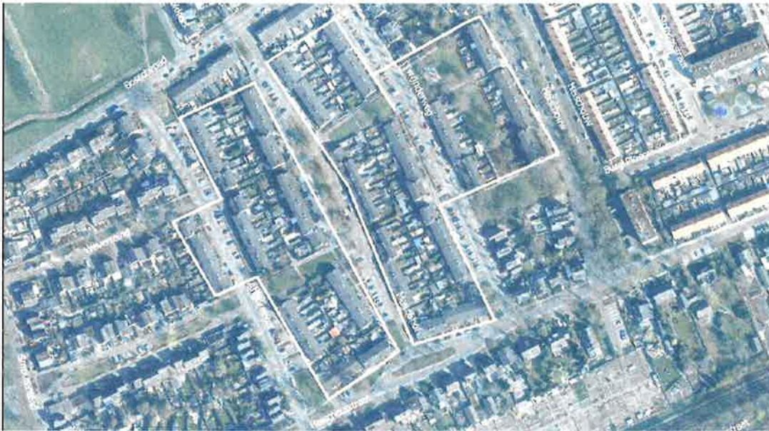
Luchtfoto van het plangebied voor het renovatieproject Boschepad eo. complex 029-12 te Oss