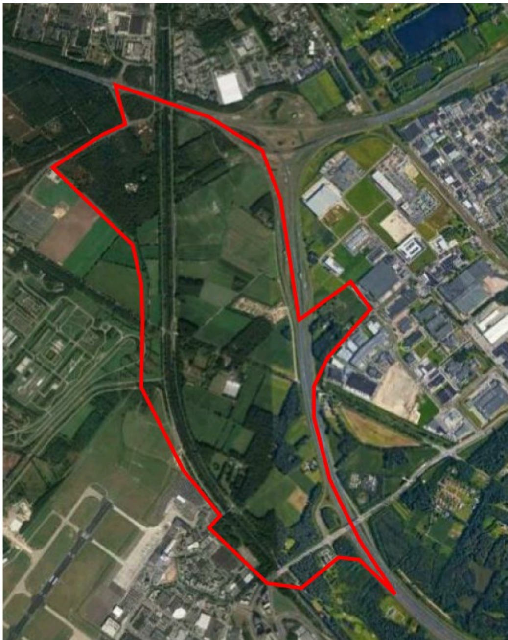
Figuur 1. Overzicht Plangebied. Ter oriëntatie: linksonder Vliegveld Eindhoven