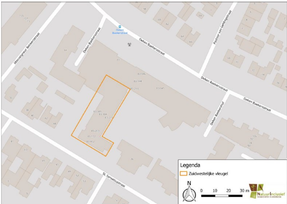
Figuur 1. Locatie Bekkershuis, Deken Baekersstraat 83 te Schijndel De activiteiten vinden plaats binnen het omliggende gebied.