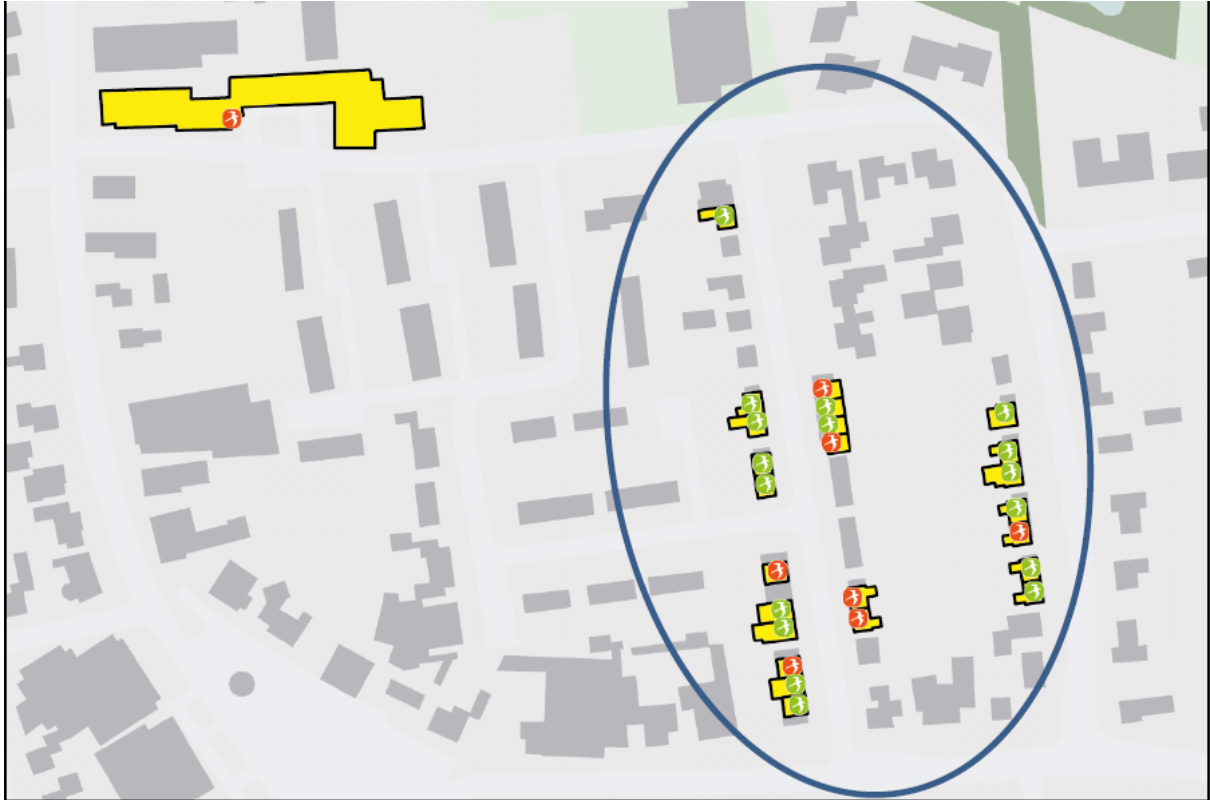
Figuur 3. Overzicht van woningen waar nesten van de gierzwaluw zijn aangetroffen (rood is woning met nest, groen is woning zonder nest).