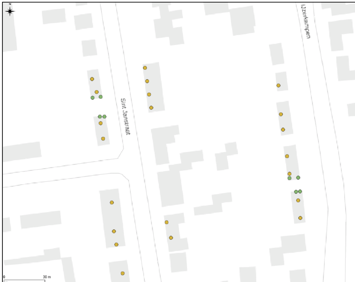
Figuur 1. Locaties tijdelijke vleermuiskasten (groen), ten opzichte van de onderzochte woningen (geel), binnen complex 3420. Van de onderzochte woningen worden bij slechts twee locaties de verblijfplaatsen aangetast, zie figuur 2.