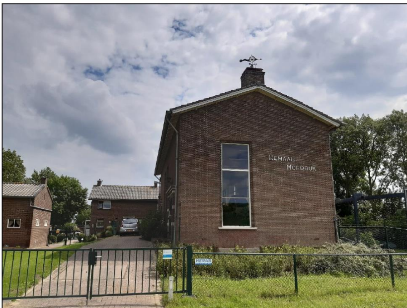
Figuur 1. Vooraanzicht poldergemaal, met daarachter het woonhuis en bijgebouw van de bewoners aan hetzelfde adres. Dit besluit heeft alleen betrekking op het poldergemaal.