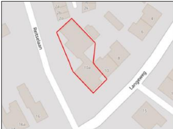
Figuur 1. Locatie Langgeweg 10 A te Haaren. De activiteiten vinden plaats binnen het rood omlijnde gebied.