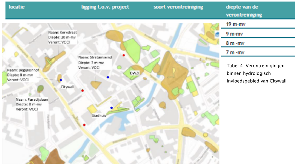
Figuur 1. Verontreinigingen binnen hydrologisch invloedsgebied van Citywall

Binnen het invloedsgebied van het bodemenergiesysteem van Citywall zijn diverse VOCl verontreinigingen aanwezig, zie tabel 4 en figuur 1.