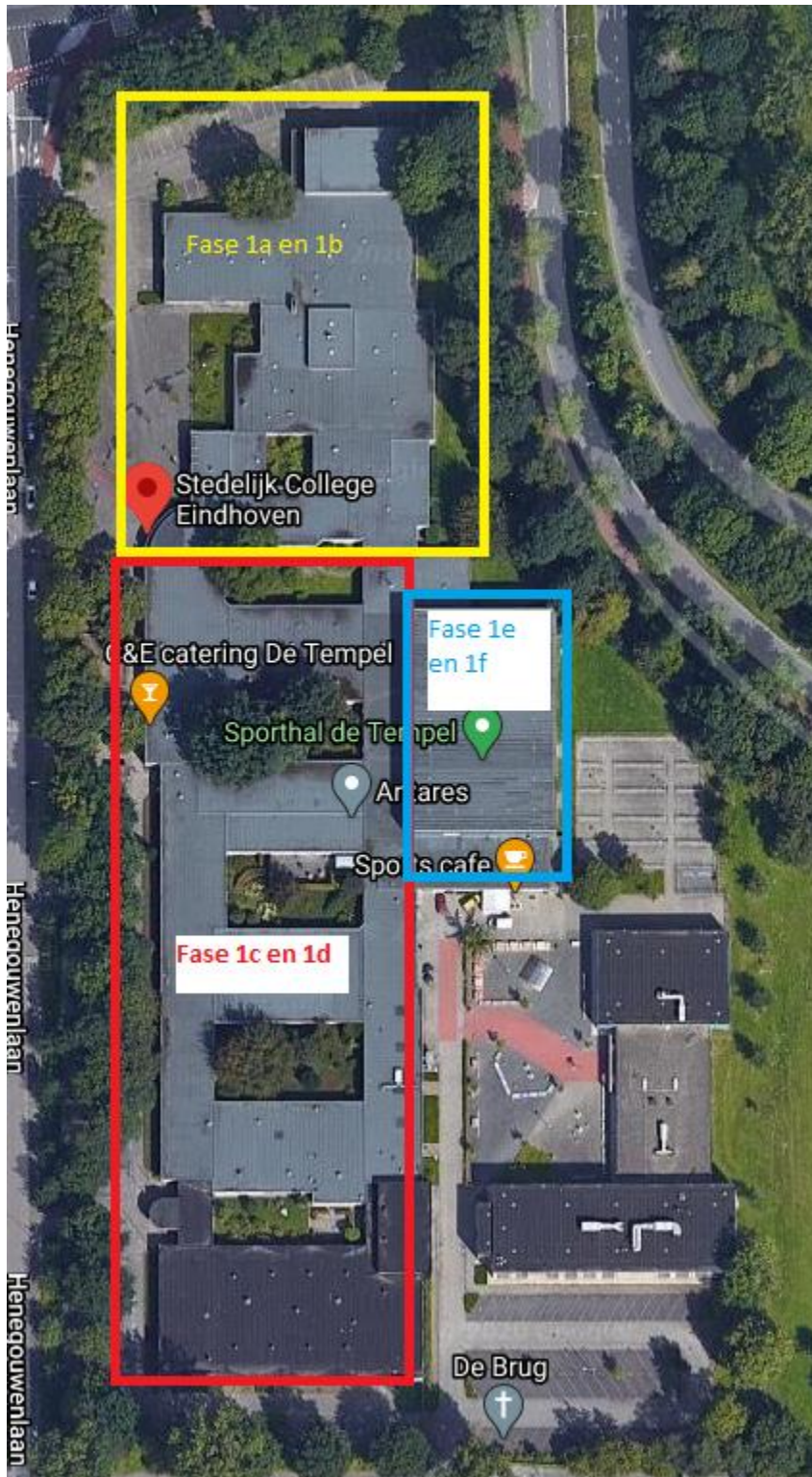
Figuur 2. De fasering van de werkzaamheden.