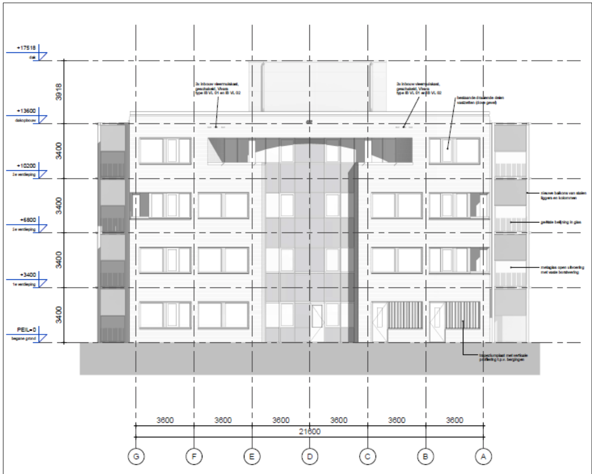
Figuur 4. Locaties van de permanente voorzieningen in de achtergevel van het gebouw.