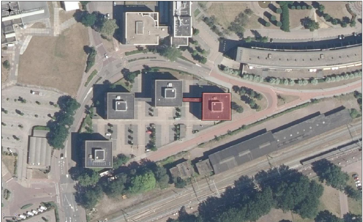
Figuur 1. Locatie Binnen Parallelweg 66 te Helmond. De activiteiten vinden plaats binnen het rood gekleurde gebied.