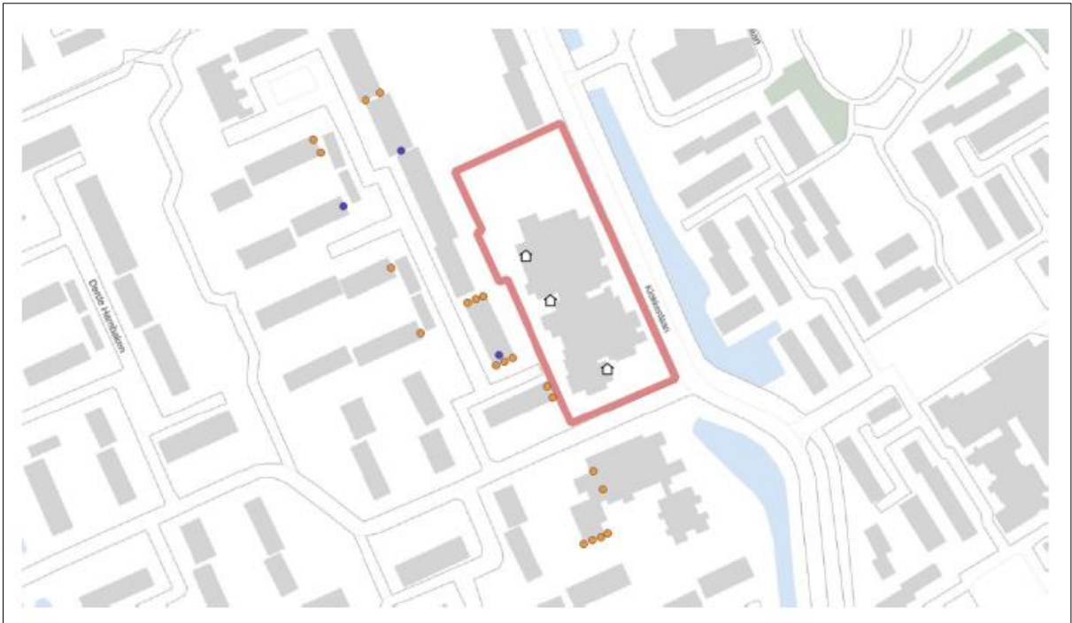
Figuur 2. Locatie van de tijdelijke voorzieningen. Een oranje stip staat voor een kleine vleermuiskast, een blauwe stip voor een grote vleermuiskast en de witte huisjes zijn de locaties van de verblijfplaatsen die verloren gaan.